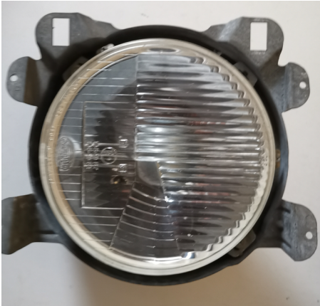
1 Strålkastare Hella kompl. till VW Typ 3, 1972-89